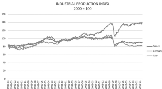
Графикон 2. Индекси индустријске производње у Француској, Немачкој и Италији 1980-2016. Извор: Eurostat (2017). Industry, trade and services - Short-term business statistics - Industry - Production in industry http://ec.europa.eu/eurostat/data/database

Сумњајући у прерано прихватање евра, 155 универзитетских професора из Немачке, потписали су изјаву 1998. са жељом да се одложи спровођење еврозоне. Тешко је за двоје економиста да се сложе око неке ствари, а да то учини тако бројна група професора је случај без преседана. Без обзира на такве предлоге, чак вапаје из струке, охоло елита у ЕУ наставила је са пројектом еврозоне јер је пред собом видела само блиставу победу евра над свим осталим виђењима будућности. Политика је надвладала савете економске струке. Од 1999. када је уведен евро, пројекат је повезан са нестабилношћу, порастом задуживања, стежањем каиша и неизвесном будућношћу.