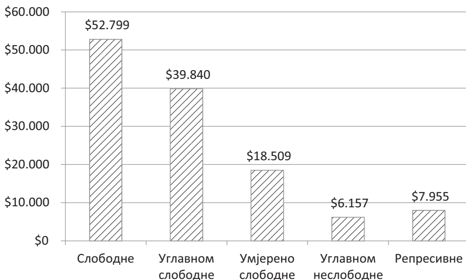
Слика 1. Разлика у БДП-у по становнику (ПКМ) сходно економској слободи земље (Креација аутора према Marotta, 2016)

слободне земље имају просјечно 52.799 долара БДП-а по становнику, углавном слободне земље 39.240 долара, умјерено слободне 18.509 долара, док углавном неслободне и репресивне, тек 6.157 и 7.955 долара, респективно. Ово је приказано на слици 1, гдје се може примијетити огромни јаз у богатству сходно разликама у економским слободама. Оно што је интересантно јесте да репресивне земље, које имају најнижи ниво економских слобода, ипак у просјеку остварују већи БДП по становнику од углавном неслободних земаља.