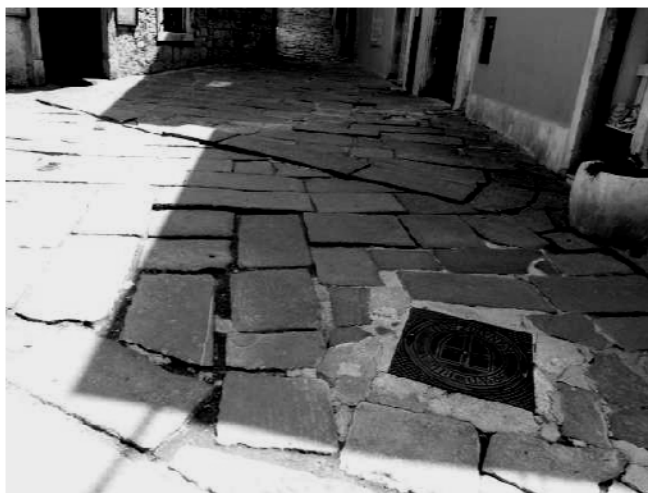
Slika 10: Pula 2009. [7]

Kameno popločanje pješačke ulice u Puli dominantno aktivira čulo dodira. Iako se na prvi pogled čini da je čulo vida dominantno aktivirano, ono je u ovom slučaju samo posrednik. Odnos tijela i prostora potencira se jednom vrstom haptičkog suprotstavljanja; težinom tijela moguće je istovremeno osjetiti strukturu kamenog popločanja i pritisak masivnih zidova starog grada, sa tek ponekim otvorom i prolazom koji omogućava rasterećenje – monosenzorni . Suprotstavljanje ove vrste naravno je pozitivno i predstavlja lounge potencijal upravo kroz ovakvo neposredno iskustvo. Kretanje kao aktivnost – tok , dio je tog iskustva, pri čemu je, zbog položaja same ulice u gradskoj matrici, rijetka mogućnost susreta i društvene interakcije – introvertni . Ovakvo intimno iskustvo nastaje upravo onim što Palasma naziva dopunjavanjem i međusobnim definisanjem grada i vlastitog tijela. (Slika 10)