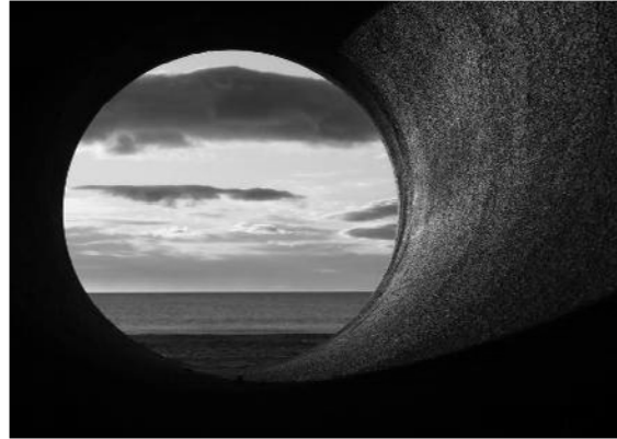
Slika 7: Sète 2012. [8]

Kadriranje Mediterana, okvirom betonske cijevi dominantno sugerira aktivaciju čula vida – monosenzorni . Položaj i oblik i dimenzija cijevi određuje mjesto boravka – mjesto , i moguće položaje tijela u prostoru. U tom odnosu, betonski okvir svojom dimenzijom omogućava boravak jedne osobe, što direktno sugerira isključivanje – biti sam sa sobom – introvertni . (Slika 7)