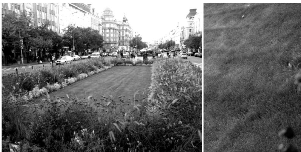
Slika 1, 2: Vjenceslavov trg, Prag 2011. [7]

Zelena površina okružena niskim rastinjem na Vjenceslavovom trgu ( Vaclavske Namesti ) u Pragu, lounge doživljaj omogućava simultano svim čulima; mogućnost boravka i ležanja na travi istovremeno provocira čulo mirisa i dodira, zvuk automobila i gradske vreve aktivira čulo