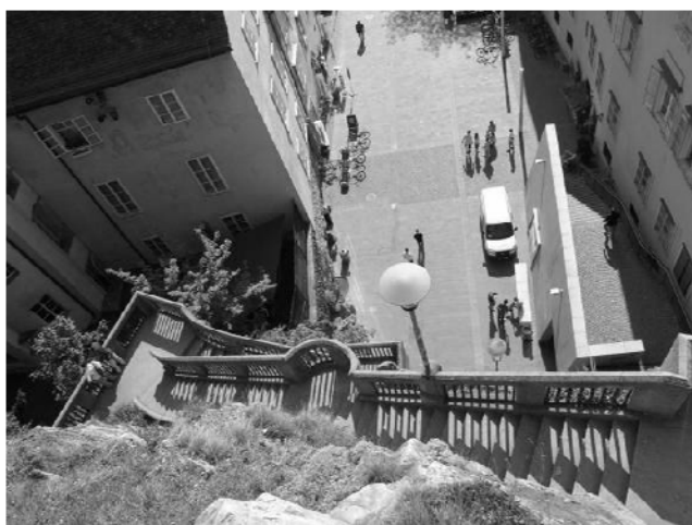
Slika 11: Grac 2011. [7]