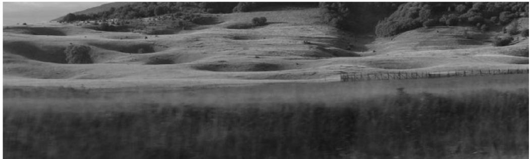
Slika 8: Manjača 2007. [7]

Vrtače obronaka Manjače sugeriraju mjesta isključivanja iz apsolutnog pejzaža pri čemu se, u odnosu na položaj tijela, dominantno aktivira jedno čulo – vida, dodira ili sluha – monosenzorni . Isključivanje u prostornom smislu podrazumijeva istovremeno mogućnost mentalnog i društvenog uključivanja – ekstrovertni . (Slika 8)