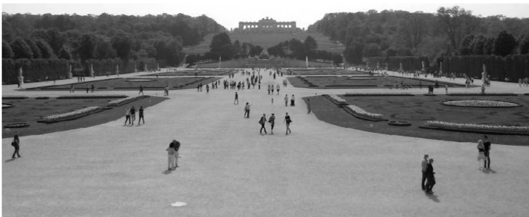
Slika 6: Park Šenbruna, Beč, 2011. [7]

Lounge potencijal centralnog dijela parka Palate Šenbrun specifične je prirode. Dimenzije prostora u odnosu na ljudsko tijelo proizvode potrebu za stalnim kretanjem – tok , i upoznavanjem sa cjelinom. Upravo potreba za ovom vrstom spoznaje osnova je lounge potencijala. Opuštanje kroz odnos tijela i prostora podstiče se vizuelno, kroz uočavanje prostornih dominantni i ambijenata vrtova, zvučno, kroz zvukove prirode koji dopiru iz vrtova i taktilno, neposredno, kretanjem šljunkovitom stazom – multisenzorni . U ovom slučaju tok nije određen vektorski, već upravo prostoranstvom, međuprostorom koji formiraju palata Šenbruna ( Schönbrunn ), slavoluk ( Gloriette ) i vrtovi sa bočnih strana. Društvena interakcija, dvije ili više osoba – ekstrovertni , podstaknuta je sa jedne strane velikim brojem korisnika što nužno podrazumijeva susrete, a sa druge prostranstvom koje ne sugerise razdvajanje i isključivanje. (Slika 6)