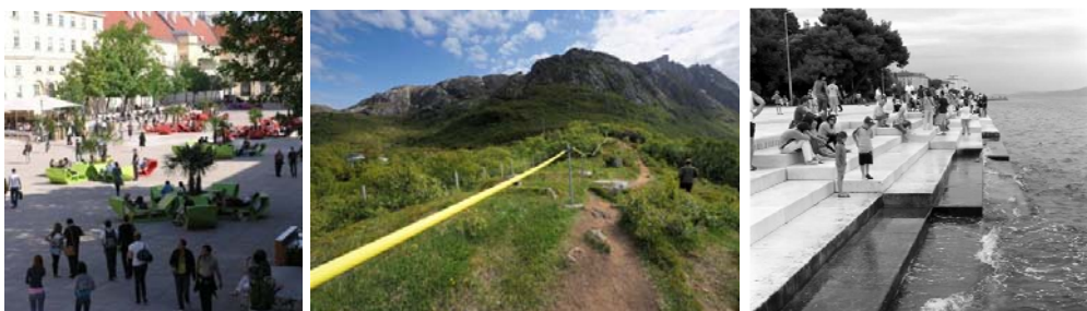
Slika 14: Lounge elementi – Trg muzeja, Beč, Austrija [7]; Slika 15: Lofoten Tourist Road, Lofoten Norveška [11]; Slika 16: Morske orgulje, Zadar [12]

Trg muzeja u Beču, koji je predstavljen kroz prikaz primjera, takođe pripada Tipu 2 i podržava sve pomenute potencijale fleksibilnim lounge elementima (slika 14), koji trgu kao sistemu tokova i lounge mjesta omogućava stalnu transformaciju. Sam element je dizajniran tako da na njemu mogu sjediti ili ležati jedna, dvije ili tri osobe, što u osnovi podstiče interakciju. Intenzitet mogućih interakcija je različit i pored lične inicijative zavisi i od načina grupisanja manjeg ili većeg broja elemenata.