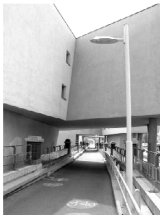
Slika 4: Beč 2011.[7]