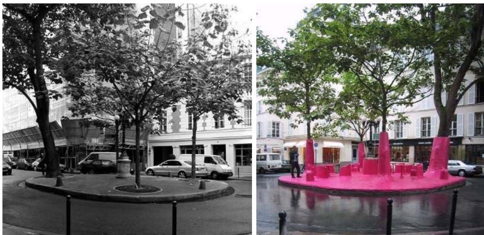
Slika 12,13: Pariz – ostrvo na kružnom toku i nakon intervencije u prostoru. [10]

Ostrvo kružnog toka u Parizu (slika 12) predstavlja Tip 2 ( multisenzorni, mjesto, ekstrovertni ) lounge potencijal. Périphériques Architectes su privremenom instalacijom koncipirali otvoreni prostor kao lounge mjesto koje podržava i intenzivira postojeće tipološke potencijale. Mjesto se označava postavljanjem stolova i stolica koji su zaliveni epoksidom roze boje i tako objedinjeni s otvorenim prostorom i stablima na ostrvu (slika 13). Na taj način logika unutrašnjeg prostora uvodi se u javni gradski prostor, postavljajući pitanje statusa javnog prostora u gradu danas [10]. Dakle, prostor se koristi zadržavanjem i boravkom, aktivirajući dominantno, pored čula vida i sluha, čulo dodira i podstičući grupacijom elemenata stopljenih sa parterom (stolova i stolica) društvene interakcije.