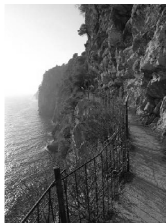
Slika 5: Popovići 2011.[7]