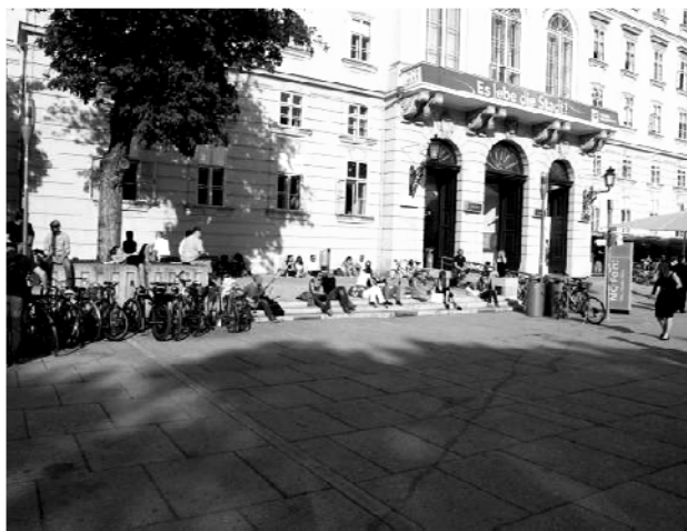
Slika 3: Trg muzeja, Beč 2011. [7]

Trg muzeja u Beču ( MuseumsQuartier Wien ), programskim okvirom nameće potrebu za lounge funkcijom. Svaki element trga, popločanje, stepenice, zid, zelena površina uz stablo, postaje potencijalno mjesto za opuštanje. Intenziviranje odnosa tijela i prostora provocira se taktilnom vizuelnom i zvučnom nivou, što predstavlja multisenzorni potencijal. Trg predstavlja sistem koji je sačinjen od protoka velikog broja ljudi i potencijalnih lounge mjesta . Protok, između ostalog, sugerira društvenu interakciju – ekstorvertni . (Slika 3)