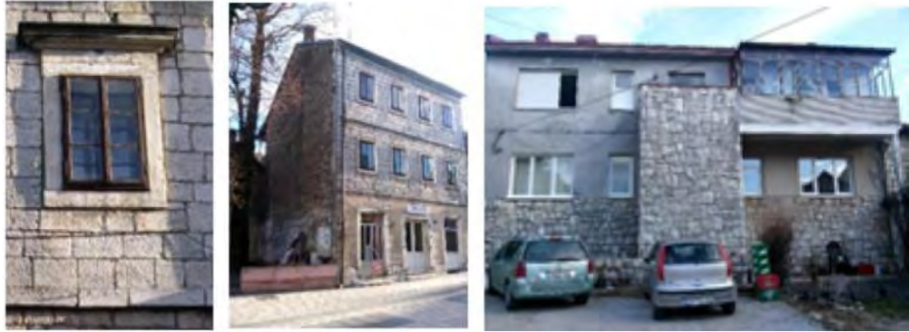
Слијева надесно: Фотографија 11. Декорација око прозора на кући с краја деветнаестог вијека, Устаничка улица, Невесиње; Фотографија 12. Зачеци колективног становања, зграда с краја деветнаестог вијека, Устаничка улица, Невесиње – са дворишног pročеља се назире дрвени балкон. Фотографија 13. Пословостамбена зграда социјалног осигурања у Невесињу, улица Цара Душана, изграђена почетком шесте деценије двадесетог вијека.