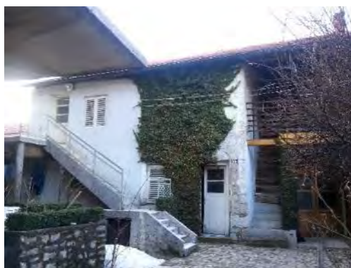
Слијева надесно: Фотографија 9. Кућа Васиљевића – улично прочеље у Устаничкој улици, Невесиње; Фотографија 10. Кућа Васиљевића – дворишно прочеље, данашњи власници тврде да су у кућу уселили након Првог свјетског рата, али да је кућа направљена крајем деветнаестог вијека.

У току четрдесетогодишње окупације Босне и Херцеговине од стране Аустроугарске монархије, стваран је архитектонски израз, суштински модеран, формално сецесијски,