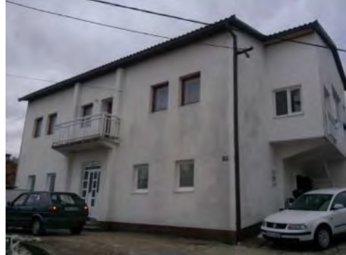
Фотографија 7. Кућа бега Башагића на Беговини, Невесиње; Фотографија 8. Кућа Караџа, данас у њој живи породица Ивановић, Беговина, Невесиње.