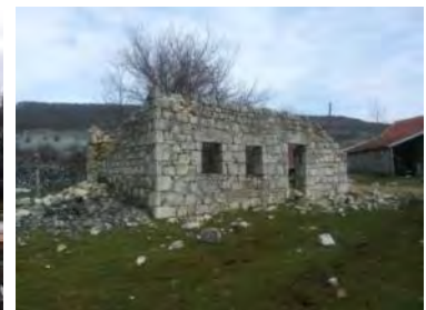
Слијева надесно: Слика 2. Основа плочаре/сламнице; Фотографија 1. Напуштена кућа на Беговини, Невесиње; Фотографија 2. Оронула кућа у селу Крекови код Невесиња