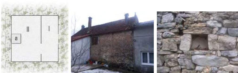
Слијева надесно: Слика 4. Основа спрата куле; Фотографија 5. Остатак куле бега Љубовића у селу Оџак код Невесиња, садашњи власници тврде да су затекли објекат са три спрата, срушили два и надоградиле прве двије етажне, зид је грађен као opus coementitium ; Фотографија 6. Удубљења у зиду за посуђе, полача Игњата Капора, село Мириловићи код Билеће.

В: Кула – веома риједак тип куће, остатак из средњег вијека. У свим кулама су живјели муслимани, док су оне војне касније прешле у руке хришћанског становништва. Због изразито квадратне основе, биле су незгодне за становање, тако да су се дограђивале, те је од тога настајао чардак на више спратова. Димензије основе куле су варирале у односу од 12 : 10 до 10 : 9. Кула је имала унутрашње и спољашње степениште: спољашње је водило на околицу – други спрат са оградом у облику ниског зида до 1м, унутра засјеченог како би се на њему могло сједити. Унутрашњост је слична као код чардака, с том разликом што су мање димензије онемогућиле развој свих просторија. Приземље је била изба, без преграда, а спрат је био као чардак: аралук (I) и оџаклија са оџаком (II). Из аралука је водило унутрашње степениште на други спрат, углавном дрвено. Кула је имала мале прозоре и кров на ластавицу (рјеђе на сомић), као и чардак [1].