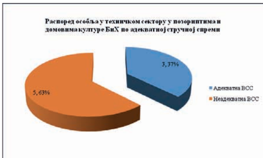
Графикон3: Распоред особља у техничком сектору у позориштима и домовима културе БиХ по адекватној високој стручној спреми

Наше истраживање смо по-сматрали из два угла: шта нам нуде садашњи кадрови у техничком сектору позоришта и каква је квалификациона структура запослених? Поента овог истраживања нам намеће закључак да се кадрови у позориштима у овом сектору и те како морају школовати а то значи и промијенити свијест и усавршити технички сектор у нашим позориштима.