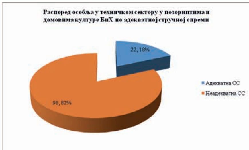
Графикон 2: Распоред особља у техничком сектору у позориштима и домовима културе БиХ по адекватној стручној спреми.