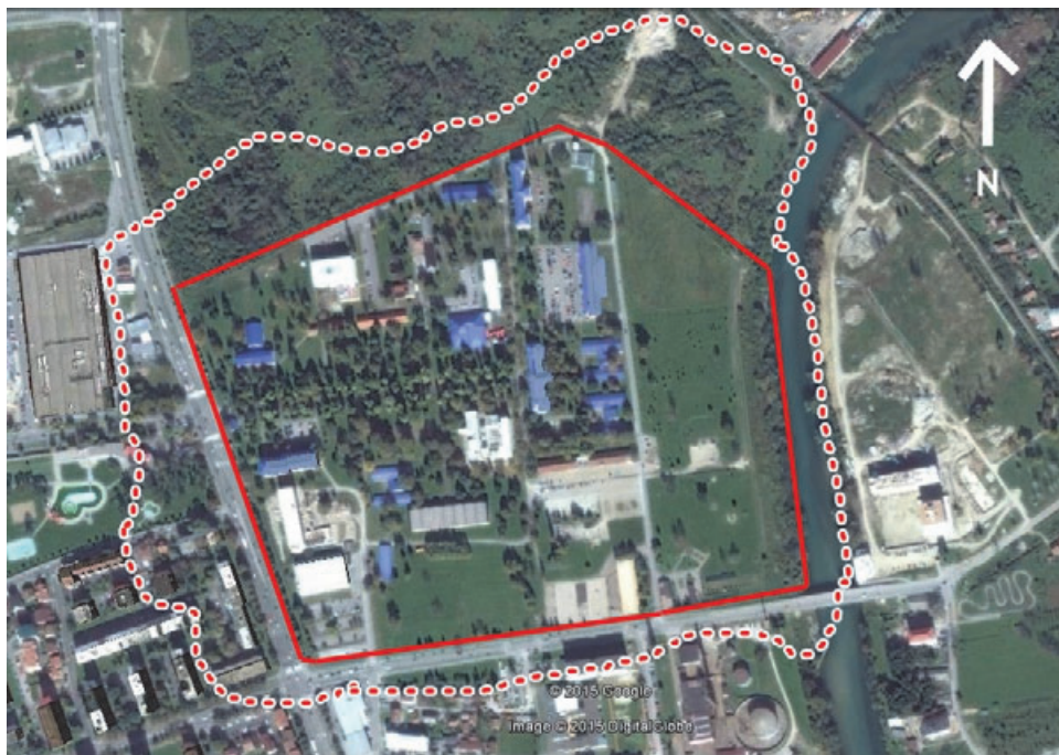
Сл. 1. Сателитски снимак истраживаног подручја Satellite image of researched area

(појашњење: пуна црвена линија приближно означава границе Заштићеног подручја - ЗП које је интензивније истраживано, док испрекидана линија означава дјелимично истражено подручје у околини ЗП)