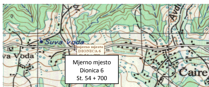
Slika 3. Mjerno mjesto na dionici 6, Rudanka – Karuše Figure 3 Measuring point at the section 6, Rudanka – Karuše