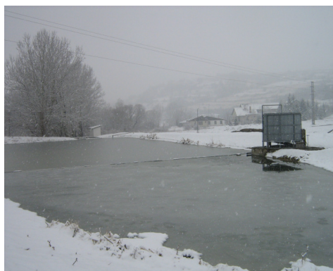
Slika 2. Snimak postrojenja u zimskim uslovima Figure 2 Video installations in winter conditions