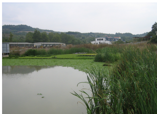
Slika 3. Snimak postrojenja u letnjim uslovima Figure 3 Video installations in summer conditions

Postrojenja za preradu otpadnih sanitarnih voda rađena na ovom principu predviđena su za korišćenje kod izolovanih objekata tipa hotela, motela, kampova i sl. Kapacitet ovih objekata kreće se u dijapazonu od 1,25 do 2,5 l/s prečišćenog efluenta [5]. U tabeli broj 1 prikazana je ukupna količina prerađenog efluenta iz postrojenja za konačnu dispoziciju otpadnih voda u recipijent reku „Izgare“ u 2011. godini. U ovu količinu vode ulazi prerađani efluent iz upravno-pogonske zgrade RMU „Soko“ i atmosferska voda sa okolne slivne površine.