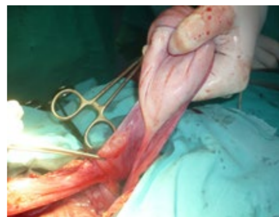
Slika 3. Ovojnica ciste i lijevi jajnik

Postoperativni tok je protekao uredno. Urednog lokalnog nalaza i dobrog opšteg stanja, djevojčica je sedmog postoperativnog dana otpuštena kući. Kontrolni pregledi su bili nakon