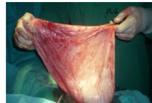
Slika 2. Ovojnica ciste sa sadržajem

Douglas-ovom prostoru nema slobodne tečnosti. Nakon UZ pregleda radiolog predlaže da se uradi CT abdomena i male karlice.