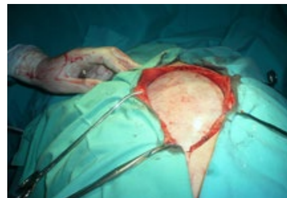
Slika 1. Otvorena trbušna šupljina i prikazana tumorska masa

UZ abdomena: u peritonealnoj šupljini se diferencira velika cistolika formacija koja potiskuje parenhimske organe. Jetra, slezina, bubrezi i mokraćni mjehur - uredan nalaz. Žučna kesa i pankreas se ne vizuelizuju; u