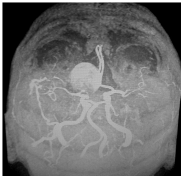
Slika 4. MRI angiografija, koronarni snimak gigantske aneurizme unutrašnje karotidne arterije desno

kontrolna MRI angiografija krvnih sudova mozga, nakon šest mjeseci koja je identična prethodnoj. Pacijentkinja više nije imala krizu svijesti i pod redovnom je internističkom terapijom antiepilepticima. Planira se kontrolni MRI krvnih sudova za jednu godinu.