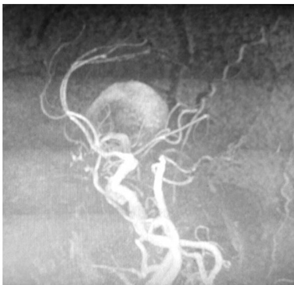
Slika 3. Gigantska, dijelom trombozirana aneurizma unutrašnje karotidne arterije desno prikazana MRI angiografijom