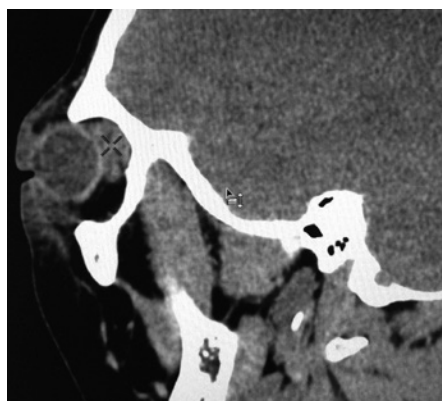
Slika 3b. Kompjuterizovana tomografija paranazalnih sinusa (CT PNS) i orbita sa kontrastom - mediasagitalni presek levo orbite, crvenim crticama označena inflamirana heterogena kolekcija (apsces)