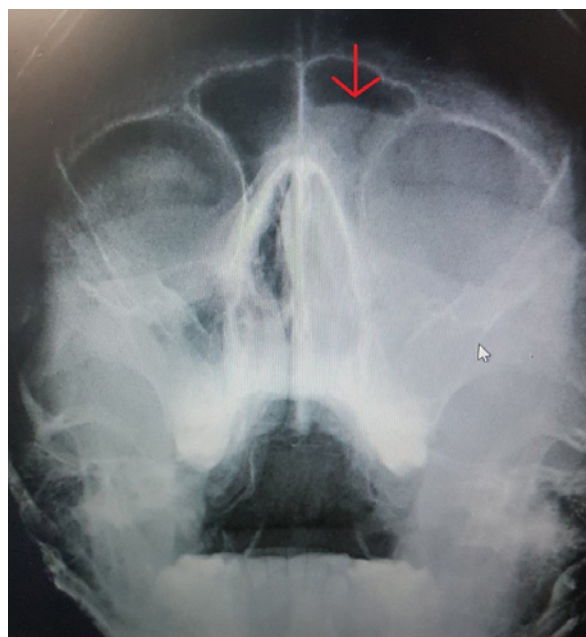
Slika 1. Klasični radiografski snimak paranazalnih sinusa. Smanjena transparentnost svih sinusa sa nivoom tečnosti u levom frontalnom sinusu (crvena strelica)

Pri kliničkom pregledu uočen je bolan i hiperemičan edem oba očna kapka levog oka, sužena rima oculi i hemoza konjunktive. Meka tkiva levog obraza su bila lako edematozna i hiperemična uz istostranu bolnu osetljivost izlazišta oba orbitalna nerva, a u projekciji čeonih sinusa perkutorno bolna osetljivost. Endonazalno obostrano imao je purulentan sadržaj uz edem i hiperemiju sluzokože nosa. Orofaringoskopski je bio izražen postnazalni drip. Ostali klinički otorinolaringološki nalazi bili su uredni. Objektivno, pacijent je