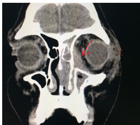
Slika 3a. Kompjuterizovana tomografija paranazalnih sinusa (CT PNS) i orbita sa kontrastom - koronarni presek, levostrani pansinuzitis sa vretenastom promenom veličine 33x9x23mm uz medijalni zid orbite (crvena strelica)