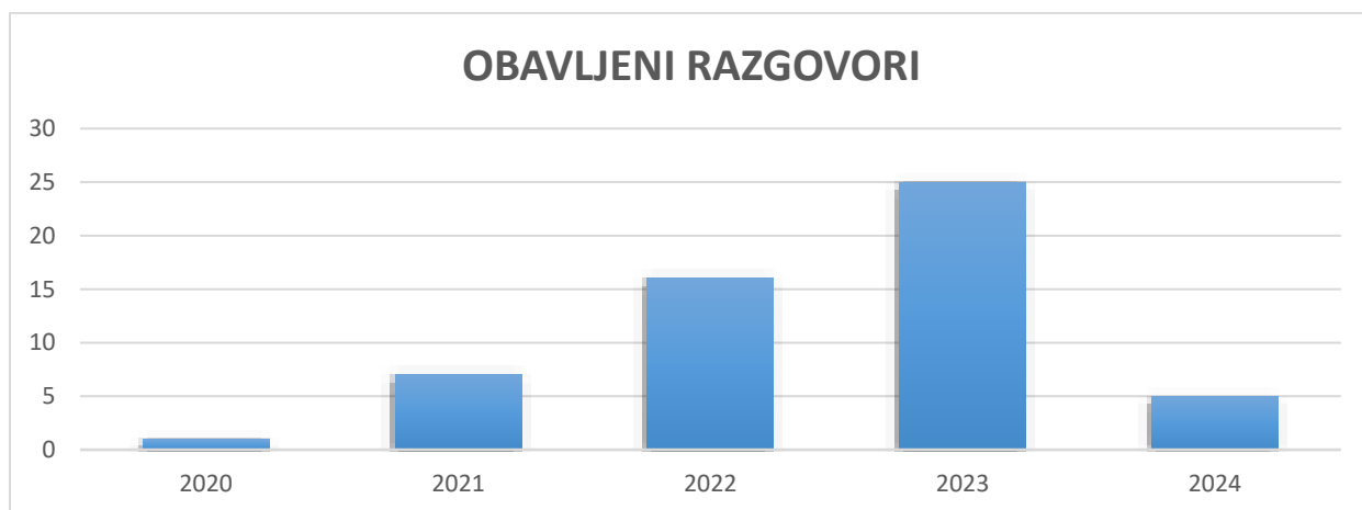
Dijagram 2. Obavljeni razgovori po godinama.

Od 54 razgovora koji su obavljeni u sudovima sa 54 žrtve ili svjedoka izvršeno je 40 saslušanja. Dešavalo se da jedno dijete ponovo bude saslušano jednom, dva a nekad i više puta. Sve ovo govori da je sudija odlučio da više puta saslušava dijete jer nije zadovoljan mišljenjem koje je dobio iz Vrhovnog tužilaštva, da je Stručna služba procijenila da dijete može da svjedoči ili je dijete samo tražilo da bude saslušano.