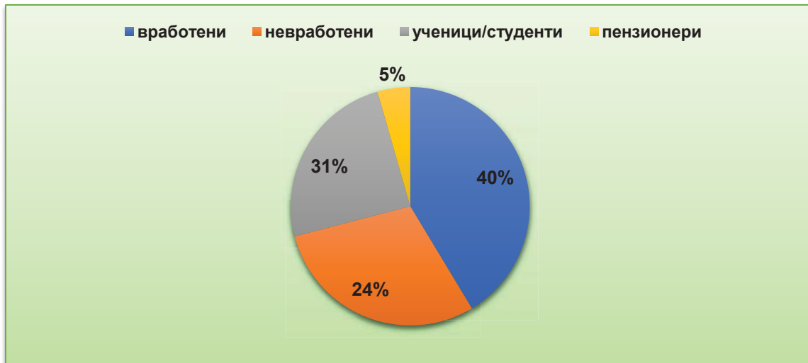
Графикон број 2: Работен статус на корисниците

Најголемиот број на корисниците, вкупно 113 или 41 % кои добиле услуга во периодот од јануари до декември 2018 година, се вработени. Околу 31 % од корисниците се ученици/студенти, вкупно 24 % се невработени и само околу 5 % се пензионери.