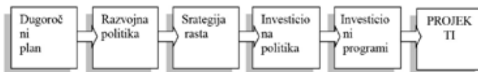
Slika 1. Međuzavisnost razvojnih odluka

Održavanje i podizanje nivoa poslovne efikasnosti preduzeća podrazumijeva uspostavljanje logičke zavisnosti između dugoročnih ciljeva i mogućnosti, stavova i načela za njihovu realizaciju, te racionalno reagovanje na impulse i mogućnosti iz okruženja i realizovanje investicija i projektnih planova (slika 1).