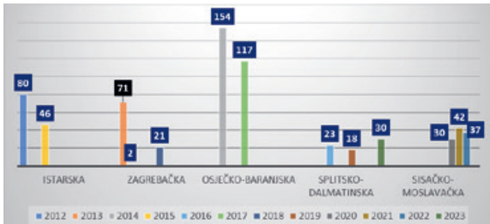
Grafikon 2. Županije s najvećim brojem kaznenih djela protiv okoliša u RH 2012-2023

Izrada: autori, prema MUP-a, RH-e, 2023.