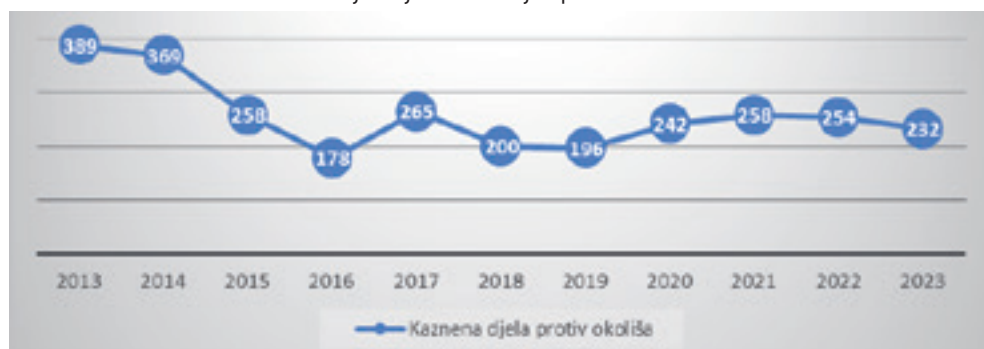
Grafikon 1. Kretanje broja kaznenih djela protiv okoliša u RH 2013-2023

Izrada: autori, prema MUP-a, RH-e, 2023.