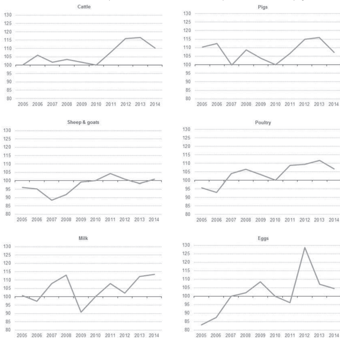
Grafikon 2. Deflated price indices for selected animal outputs, EU-28, 2005–14.png

maslinovo ulje) EU za period od 2005. do 2014. godine, uzevši 2010. godinu za baznu.