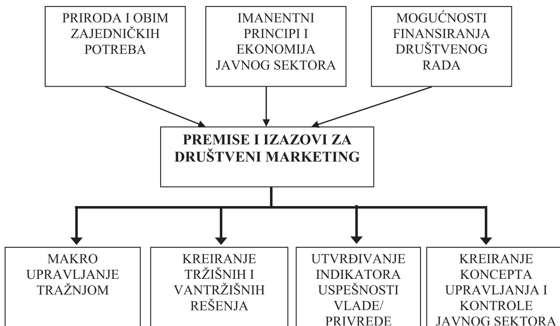
Slika 5. Premise i izazovi za društveni marketing