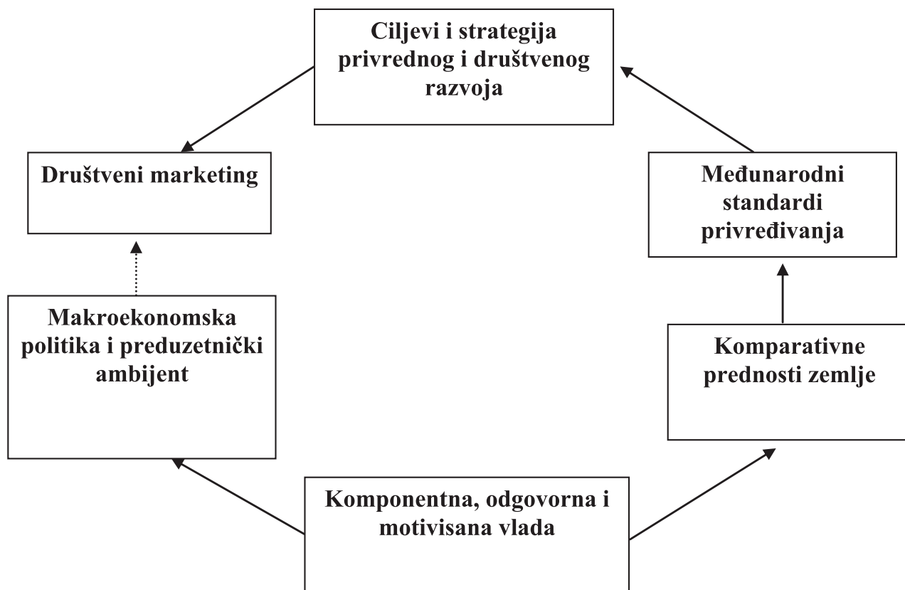
Slika 1. Sidro propulzivnog (realnog i kvalitetnog) razvoja

„meke moći“, mudro usaglase relevantne komponente kao što su: 1) komparativne prednosti zemlje, 2) međunarodni standardi privređivanja, 3) ciljevi privrednog i društvenog razvoja, 4) društveni marketing i 5) makroekonomska politika i preduzetnički ambijent.