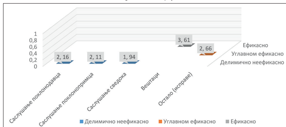
Grafikon 2: Ocena dokaznog kredibiliteta pojedinih dokaznih sredstava