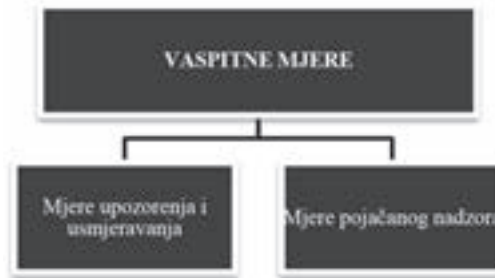
Slika 4: Vaspitne mjere koje se izriču maloljetnicima za prekršaje u prekršajnom zakonodavstvu Republike Srbije

Zakonodavac izričito naglašava da samo sud može maloljetniku izreći vaspitnu mjeru, novčanu kaznu, kaznene poene, kaznu maloljetničkog zatvora i zaštitnu mjeru. Dakle, za razliku od odraslih učinilaca prekršaja, kojima novčanu kaznu kao prekršajnu sankciju može izreći i ovlaštenu organ, odnosno ovlašteno lice prekršajnim nalogom u skladu sa zakonom, u smislu odredbi člana 87 zakona, kod maloljetnika ovakva mogućnost ne postoji. Ovim se želio podvući poseban značaj prekršajnog postupka koji se vodi prema maloljetniku, koji se ipak ne može poistovijetiti sa prekršajnim postupkom protiv punoljetnog lica 35 .