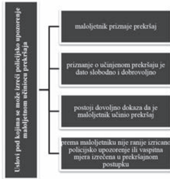
Slika 2: Uslovi pod kojim se može izreći policijsko upozorenje maloljetnom učiniocu prekršaja u prekršajnom zakonodavstvu Republike Srpske

Policijски službenik koji izriče policijsko upozorenje ima obavezu ukazati maloljetnom učiniocu prekršaja da je njegovo ponašanje štetno i neprihvatljivo u društvu, kao i da može prouzrokovati određene posljedice, navodeći pri tome o kakvim posljedicama se radi. Naime, policijski službenik ima obavezu ukazati maloljetniku da se protiv njega može pokrenuti čak i prekršajni postupak u kojem će mu biti izrečene strožije prekršajne sankcije ukoliko ponovo počini prekršaj. Saglasno prednjem, svrha preduzimanja alternativne mjere policijskog upozorenja jeste da se protiv maloljetnog učinioca prekršaja ne pokreće prekršajni postupak pred sudom i da se pozitivno utiče na pravilan razvoj maloljetnog lica u budućnosti, kao i na jačanje lične odgovornosti maloljetnika kako u daljem životu ne bi ponavljao ili činio nove prekršaje 15 .