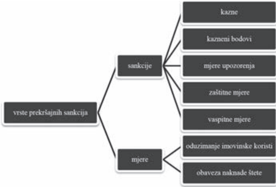
Slika 1: Vrste prekršajnih sankcija u prekršajnom zakonodavstvu Republike Srpske

Za maloljetne učinioce prekršaja (radi se o populaciji koja nije statistički ni tako mala u većini zemalja, a u procentima čak i do 20% od ukupnog broja populacije u sukobu sa zakonom) u važećem Zakonu o prekršajima Republike Srpske od 2014. godine predviđene su posebne alternativne mjere i prekršajne sankcije (poput onih iz Zakona o zaštiti i postupanju sa djecom i maloljetnicima u krivičnom postupku u Republici Srpskoj iz 2010. godine). Radi se o posebnim oblicima reakcije društvene zajednice na nedopuštena ponašanja maloljetnika koji imaju iznad svega specijalno–preventivni karakter, odnosno onim oblicima koji, u svakom slučaju vode vansudskim oblicima intervencije nadležnih ovlaštenih organa 10 . Uz to, alternativne mjere 11 predviđene prekršajnim zakonima predstavljaju i