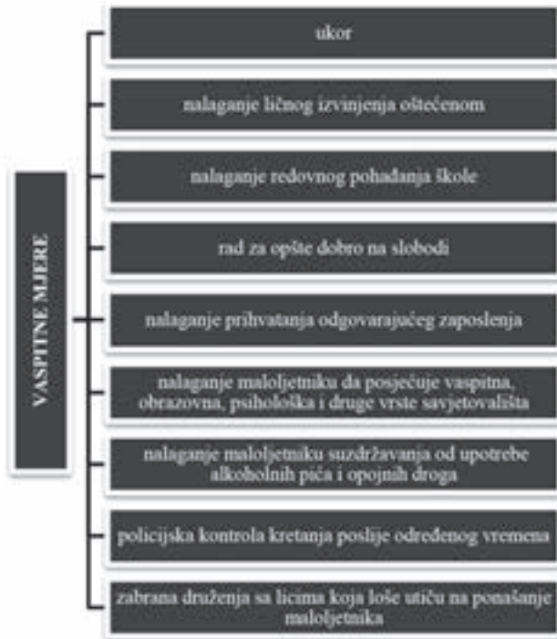
Slika 3: Vaspitne mjere u maloljetničkom prekršajnom zakonodavstvu Brčko distrikta BiH

Koju će od navedenih vaspitnih mjera sud izreći, zavisi, prije svega od interesa maloljetnika i oštećenog lica, posebno imajući u vidu da se primjenom konkretne vaspitne mjere ne ugrozi redovno školovanje maloljetnika ili njegov radnopravni status. Inače, izbor i primjena vaspitnih mjera vrši se u saradnji sa roditeljima, odnosno starateljima maloljetnika i organima socijalnog staranja. Maksimalno trajanje vaspitnih mjera je godinu dana, a sud može naknadno ukinuti ili izmijeniti vaspitne mjere koje je odredio maloljetnom učiniocu prekršaja 26 .