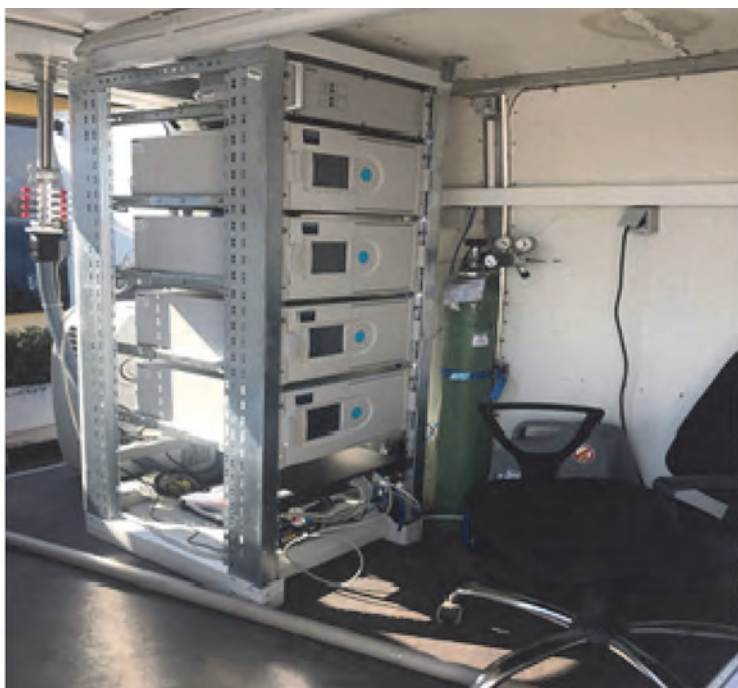
Сл. 4. Анализатор HORIBA JAPAN Fig. 4. HORIBA JAPAN analyser

Air quality monitoring was carried out by a mobile environmental laboratory equipped with appropriate analysers and a sampler (Fig. 4). The ultraviolet fluorescence method was used to determine the level of SO 2 in the surrounding air (BAS EN 14212:2013), nitrogen oxides were measured by chemiluminescence (BAS EN 14211:2013), carbon monoxide (CO) was measured by non-dispersive infrared spectroscopy (BAS EN 14626:2013), and ground-level ozone by ultraviolet photometry (BAS EN 14625:2013). The analyser for measuring total hydrocarbons and methane uses the flame ionization method, and the gravimetric sampler for total solid particles and PM 10 uses the standard gravimetric method (BAS EN 12341:2015) (Fig. 5).