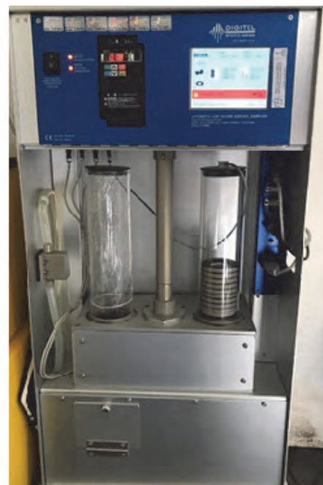
Сл. 5. Гравиметријски узоркивач укупних чврстих честица и PM 10 Fig. 5. Gravimetric sampler of total solid substances and PM 10