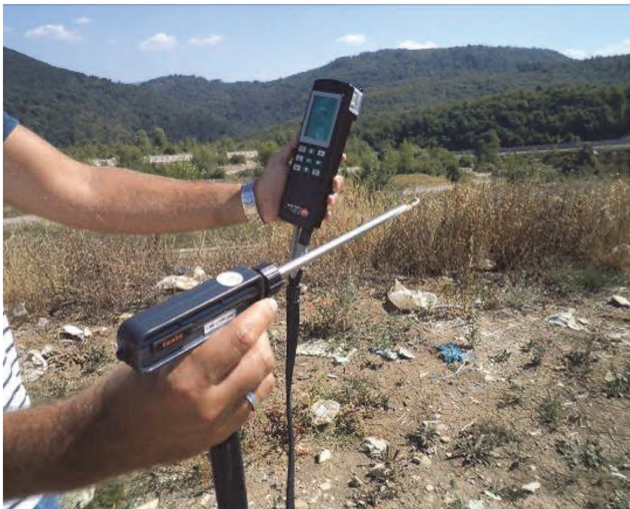
Сл. 3. Анализатор гасова Testo 325

In order to measure landfill gas emissions at the “Crni vrh” landfill, in the period from August 2022 to March 2023, measurements were made once a month of the following parameters: oxygen, methane, carbon dioxide and hydrogen sulphide. To measure temperature and gas flow, Testo 325, a multifunctional gas analyser, was used, which works on the basis of electrochemical sensors (Fig. 3). Additionally, the Dräger X-am 2000, a portable device equipped with sensors for measuring specific ( H_2S , CO , O_2 ) and flammable/explosive gases ( CH_4 ) generated in a hazardous environment, was used.