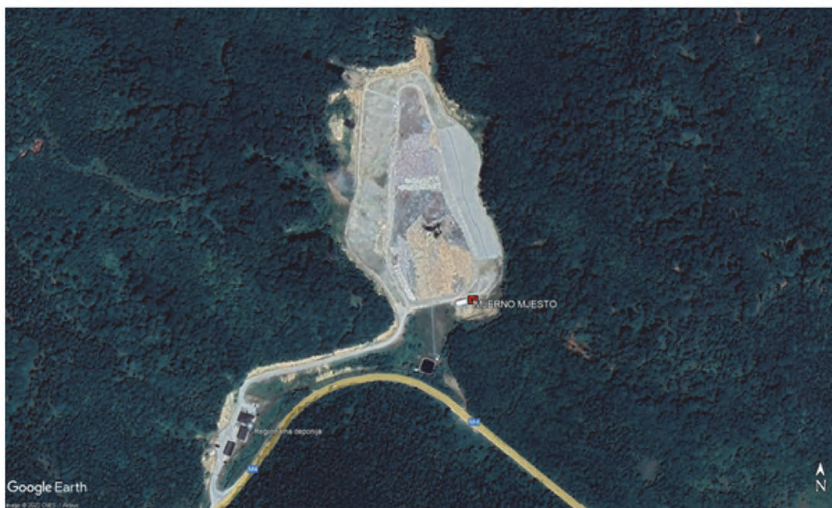
Сл. 2. Сателитски снимак локације (Google Earth снимак)

Measurements of immission concentrations of relevant air quality indicators were performed at the landfill itself (on the plateau next to the canopy for the placement of machinery) (Fig. 2).