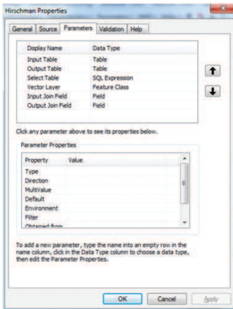
Слика 1. Дефинисање параметара у ArcGIS апликацији Figure 1. Defining parameters in ArcGIS application

Покретањем увезене скрипте покреће се алат за израчунавање и визуелизацију HHI , којом приликом се отвара картица за унос назива параметара (Слика 2). Уношењем назива параметара (дефинисањем њихових путања) у понуђена поља у отвореној картици, те кликом на опцију „ОК“, покреће се извршна наредба којом се реализује дати алгоритам за израчунавање и визуелизацију HHI . Добијени резултати се читавају како су дефинисани код описа математичког концепта индекса.