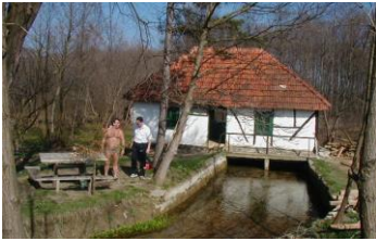
Sl.4 Stara vodenica "Čokička " (2005.g)