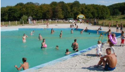
Sl.6 Heksagonalni bazen sjeverno od izvora Toplice