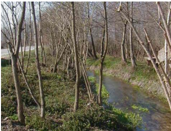
Sl.8 Rijeka Toplica nizvodno uz regionalni put (2003)