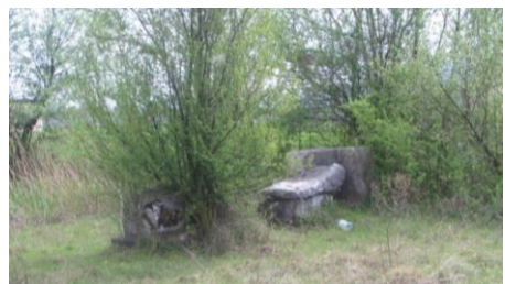
Sl.9 Nekropola stećaka (2009)