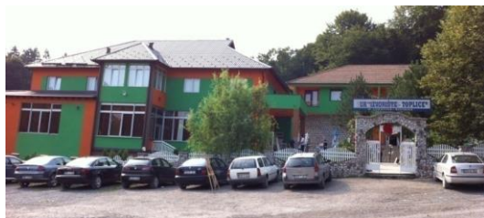
Sl.3 Novi hotel sagrađen uz stari hotel "Toplica" (2015)