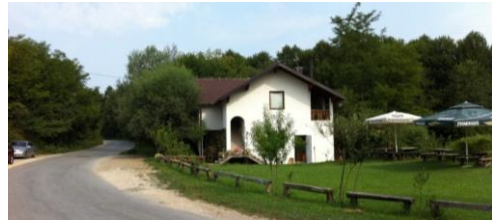
Sl.5 Novi restoran ispred sušene vodenice "Čokička" (2013)