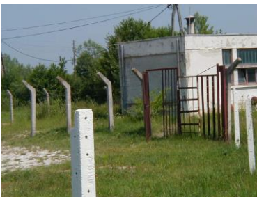
Sl.10- Pumpno postrojenje na Toplici (2006)