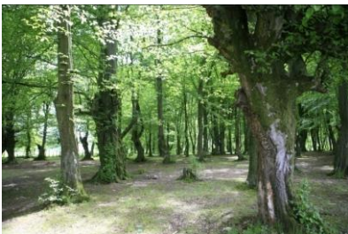
Sl.12 Stoljetna bukova šuma - vodozaštitna zona