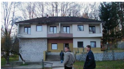
Sl.2 Stari hotel-odmaralište „Toplica“ (2005)

Nešto dalje prema zapadu u koritu nekadašnje riječice Toplice općina Živinice je 2002. godine sagradila heksagonalni bazen ali u nedostatku sredstava izgradila je samo armirano -betonske zidove bazena dok je dno bazena ostalo šljunkovito ali je nekoliko godina kasnije općina izvršila betoniranje i dna bazena tako da je on danas ograđen i u potpunoj funkciji. Oko njega je zadnjih godina sagrađeno nekoliko pomoćnih objekata. Punjenje bazena se vrši iz potočića koji teče nekadašnjim koritom rijeke Toplice .