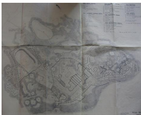
Slika. 16- Prostorna koncepcija urbanističko-regulacionog plana SRTC „Toplica“ (iz 1975 godine )