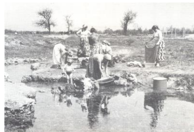
Sl. 13- Na izvorištu Toplice oko 1960-te