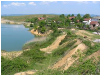
Sl.14 - Jezero Bašigovci prije uređenja (2005)