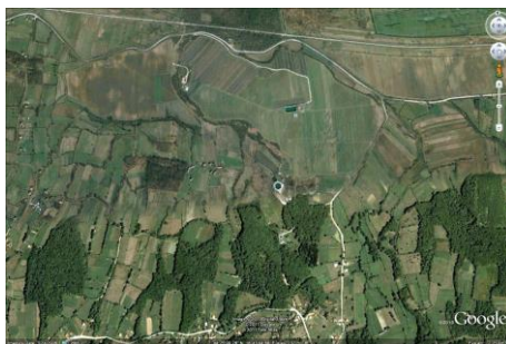
Slika.1 Satelitski snimak Topličkog polja 2012.god.

Stara vodenica pored ove nekropole je takođe nakon kaptiranja izvorišta 1975-1977 godine porušena dok je druga vodenica pored regionalne ceste Živinice-Šekovići nakon rata renovirana od strane vlasnika a zadnjih godina je pored nje isti vlasnik sagradio riblji restoran.