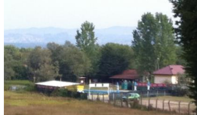
Sl.7 Isti prostor sa novim pratećim objektima