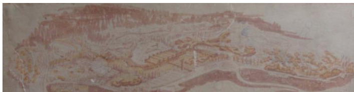
Slika.17- Perspektivni izgled SRTC „Toplica“ (izvor: Urbanističko-arhitektonsko-građevni biro „Ar-69“ iz Zagreba, arh.Branko Vasiljević)

Ovakvim konceptom bili bi izgrađeni objekti i instalacije te uređene površine kako slijedi :