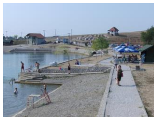
Sl.15 - Jezero Bašigovci poslije uređenja (2012)