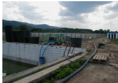
Sl.11- Olimpijski otvoreni bazen pretvoren u rezervoar vode (2006)