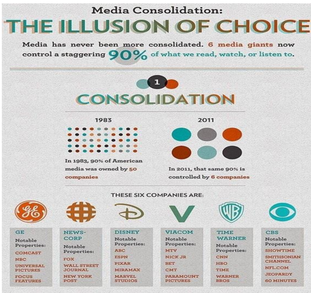
Slika 2. Kontrola pomoću elektronskih medija 32

U SAD je 1983. godine 50 kompanija kontrolisalo 90% medija. U 2011. godini 6 kompanija posjeduje 90% medija. Takav odnos vlasništva u navedenim medijskim kompanijama ima ulogu kontrolora preko većinskog kapitala u interesu vladajuće oligarhije.