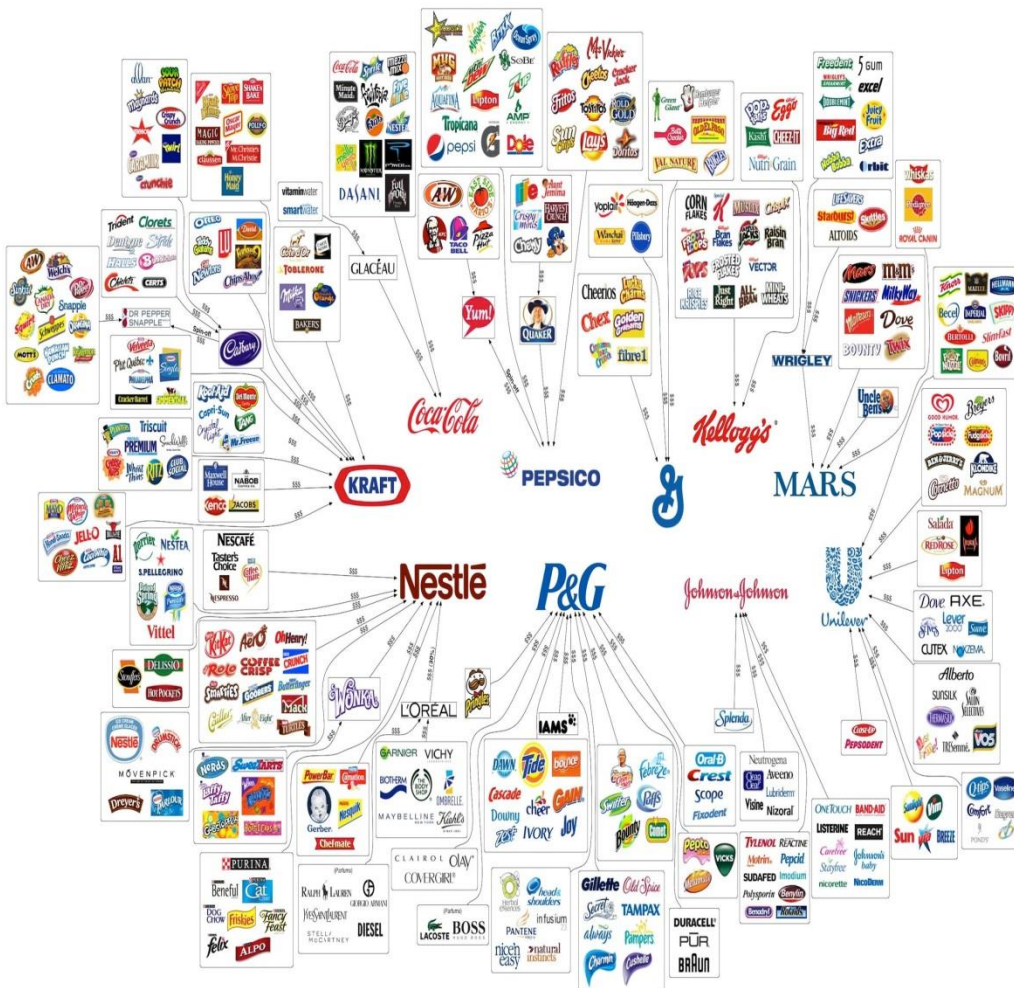
Slika 1. Kontrola pomoću trgovinskih megakorporacija 31

Korporacija Nestle je 200 milijardi dolara vrijedna. Poznata po čokoladi, ali je jedna od najvećih prehrambenih kompanija u svijetu. Ima gotovo 8.000 različitih brendova širom svijeta, a ima udjela ili je partner u još velikom broju drugih. Uključena u ovu mrežu je kompanija L'Oreal, gigant dječje hrane Gerber, brend proizvođača odjeće Diesel i proizvođači hrane za kućne ljubimce Purina i Friskies.