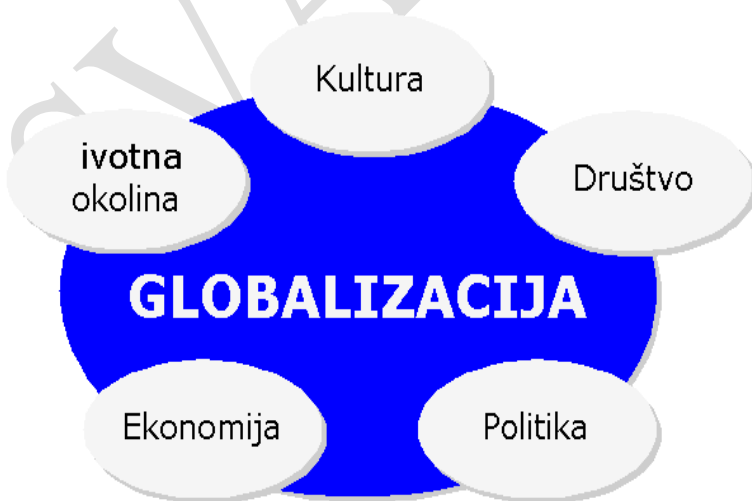
Slika: Ključne determinante globalizacije

Pri definisanju razlike između pet ključnih determinanti globalizacije (kao što je prikazano na slici 1), važno je napomenuti da se te dimenzije ne mogu potpuno izolovano posmatrati jedna od druge. Tako se, na primjer, globalni problem zaštite okoline ne može posmatrati odvojeno od dimenzije "ekonomija" niti od dimenzije "politika". Ta povezanost ne samo između aktera, nego i između područja, jedna od posebnosti globalizacije.